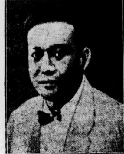
MUSO Ia sudah lari dari Madiun?